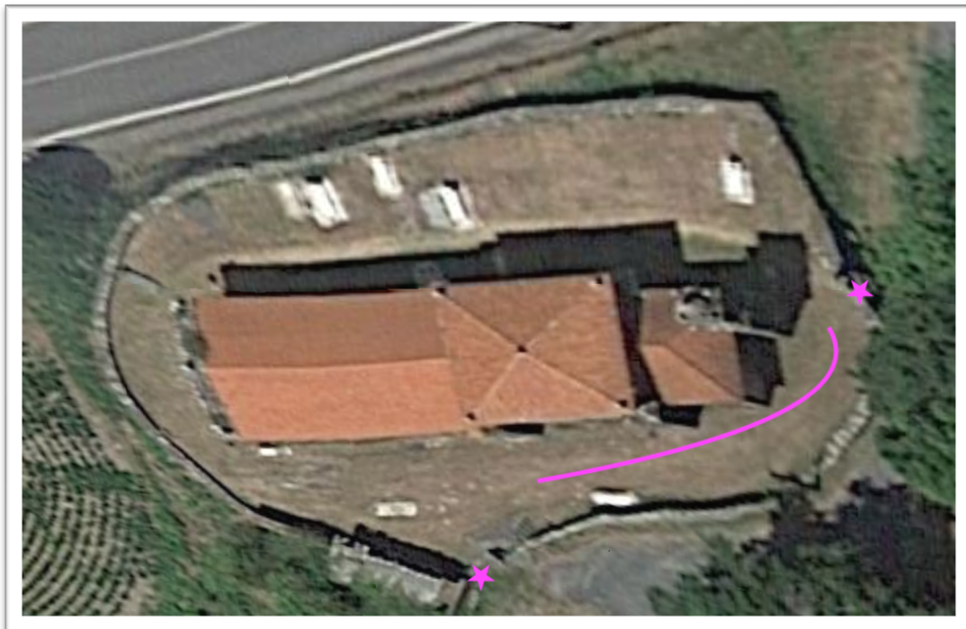
Figura 6. Vista xeral do cemiterio onde se sinalan as dúas entradas e toda a área na que se sitúan as dúas hipóteses máis plausibles sobre a localización da fosa.