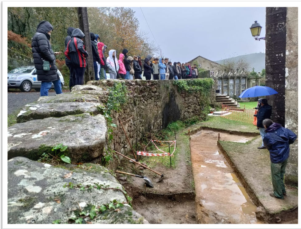
Figura 12. Detalle da visita do IES Leliadoura á fosca do cemiterio antigo de Vilacoba