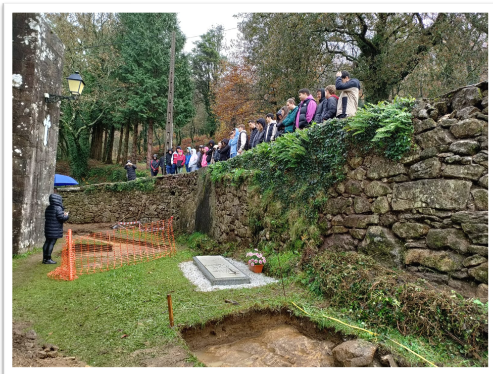
Figura 11. Visita do IES Leliadoura á fosa do cemiterio antigo de Vilacoba