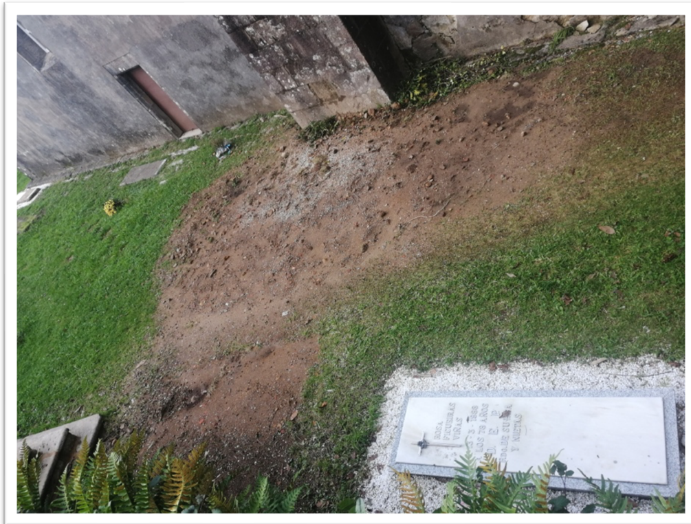
Figura 10. Aspecto que presenta outras das zonas nas que se realizaron as sondaxes tras os traballos arqueolóxicos