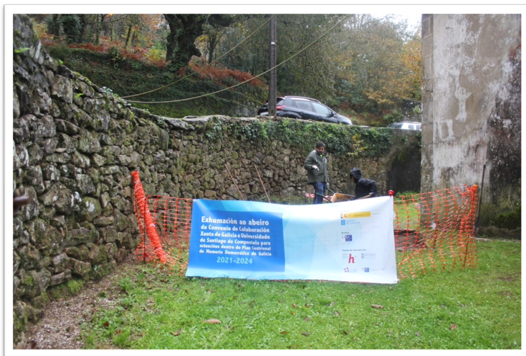
Figura 7. Inicio dos traballos arqueolóxicos no cemiterio antigo de Vilacoba

Como último, cabe mencionar o eco que tivo na prensa local a intervención en Lousame, dando a coñecer á cidadanía os traballos desevoltos (figura 13).