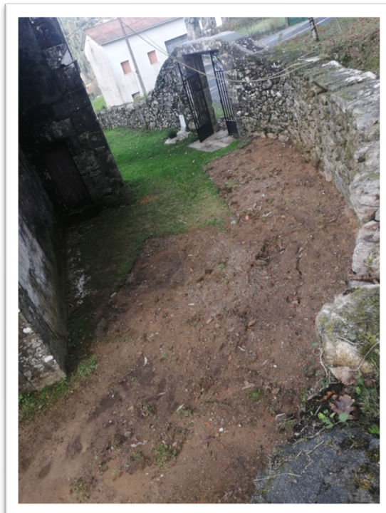
Figura 9. Aspecto que presenta unha das zonas nas que realizaron as sondaxes e a inhumación tras os traballos arqueolóxicos