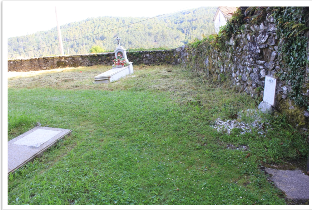
Figura 5. Área sinalada como posible localización da fosa onde se atopan tumbas de bebés.