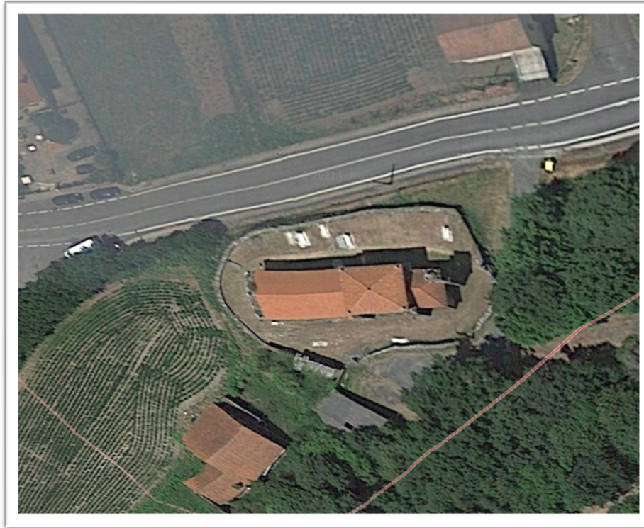
Figura 1. Igrexa e cemiterio de Santa Eulalia de Vilacoba (Lousame) na actualidade.