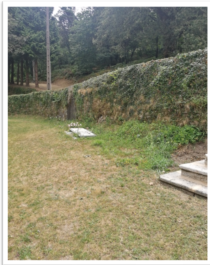
Figura 3. Área sinalada como posible localización da fosa.