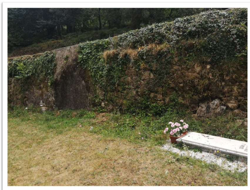
Figura 4. Detalle da zona sinalada como localización da fosa onde o muro presenta certas particularidades.