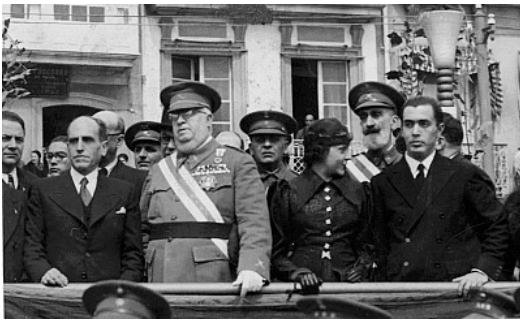
Presidencia de desfile militar con las máximas autoridades civiles y militares de A Coruña. Fondo Suárez Ferrín 3