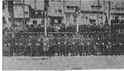
Imagen de prensa del mismo desfile de la izquierda 2