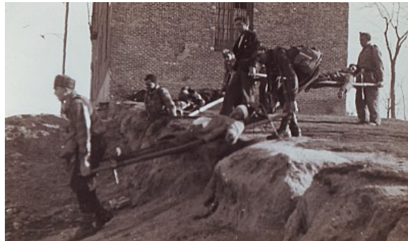
Sanitarios en el frente de Madrid 10