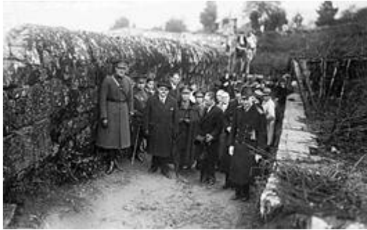
Visita del alcalde de Vigo al cementerio de Pereiró 5

En buena medida la imagen de 1934 y la entrevista a su nieto en 2006 se encuentran en la memoria transmitida de 1936 como una potente metáfora de la legalidad republicana subvertida.