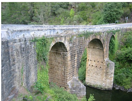
Ponte Bibei.-Trives (Ourense) 21

Buena parte de los lugares a los que con objeto de conmemoración y homenaje,