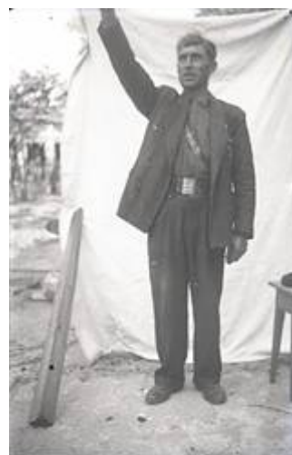
Fondo Quiñoy Pandelo 7

Así como también lo es, en vivo contraste, esta otra imagen en la que años después, en otra fotografía privada se incorporan elementos ideológicos. El militante de Falange, uniformado, saluda a la romana, con un telón de fondo con el que se pretende destacar la figura al tiempo que remedar las convenciones del género del retrato de estudio. Es sin embargo el uso de la fotografía privada, en un desencuadre del telón trasero, la que nos permite descubrir otra realidad detrás de la representación ideológica construida y asomarnos en la esquina izquierda a la casa rural y emparrado que en realidad sirven de entorno al retrato.